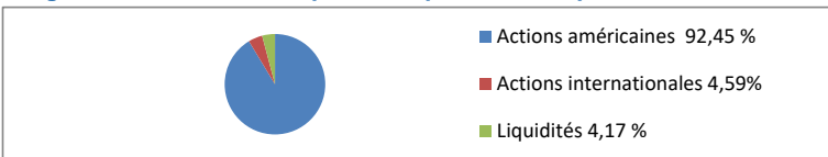
Diagramme circulaire indiquant la répartition des placements