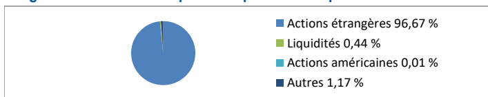
Diagramme circulaire indiquant la répartition des placements

9.92 9.49 7.62 2.84 2.80 2.48 2.34 2.09 2.08 2.08 43.74 76