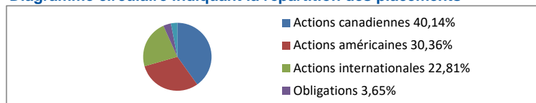
Diagramme circulaire indiquant la répartition des placements