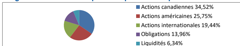
Diagramme circulaire indiquant la répartition des placements