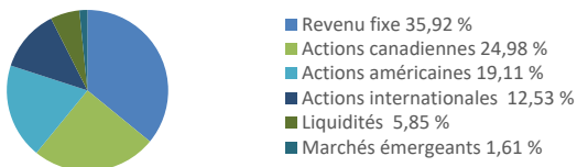
Diagramme circulaire indiquant la répartition des placements