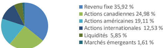
Diagramme circulaire indiquant la répartition des placements