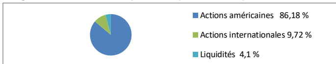
Diagramme circulaire indiquant la répartition des placements