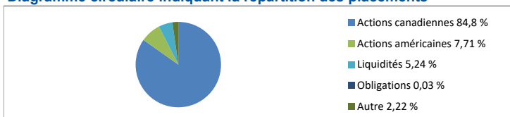
Diagramme circulaire indiquant la répartition des placements